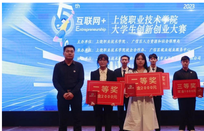
(二等奖 20 幼管 1 付可熙团队 右一)