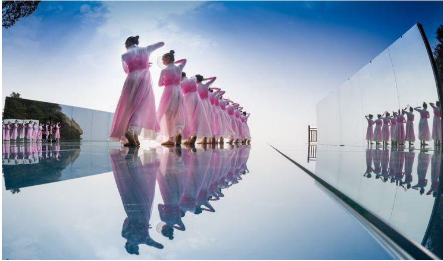
女子群舞《镜水桃花》

漫步山间，吹笛一曲，悠扬飘荡，清音回响，山林更显幽静。高山峻岭荡笛声，好似九霄天籁音。