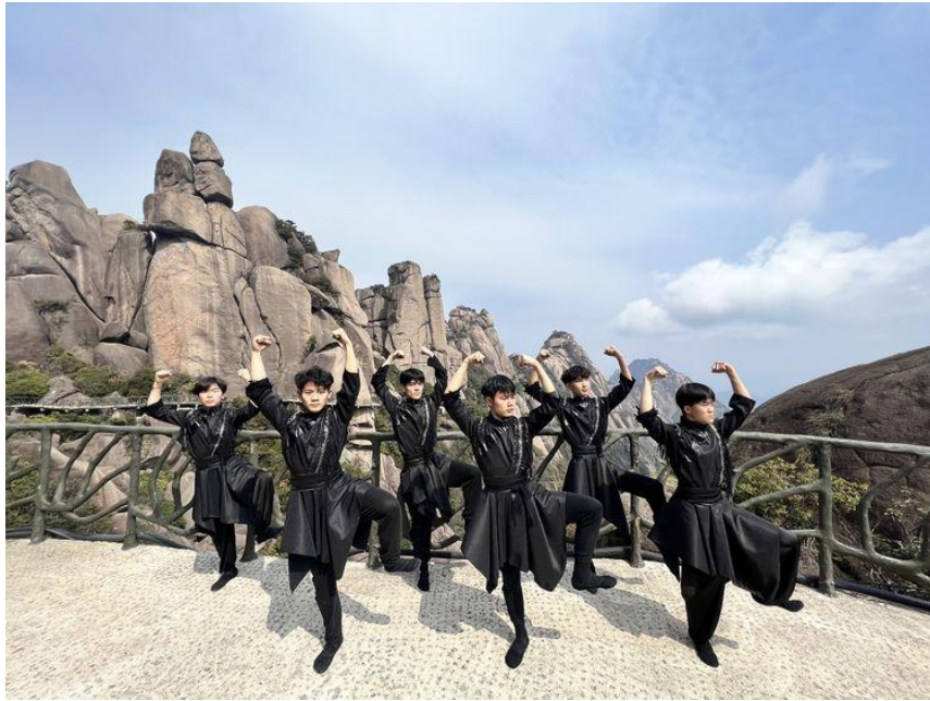
男子群舞《幻世金刚》

曲调气势磅礴，音乐形象鲜明，快速段落紧张激烈，慢速段落优美抒情。双手在琴弦上来回弹奏，优美的旋律在空中飘荡。